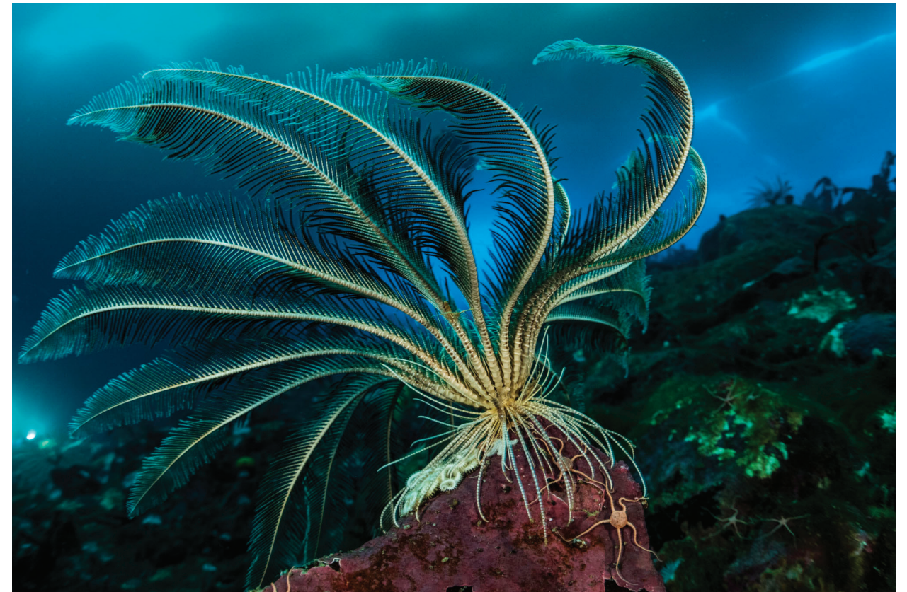
在东南极冰层下的海底, 一颗巨大的海羽星用它的叶状手臂伸手去抓食物颗粒。海羽星是动物不是植物, 有些物种, 包括这个在内, 可以游泳。这些海星的表亲呈现了南大洋丰富的生物多样性, 企鹅也是其中之一。

根据联合国粮食及农业组织的数据, 世界上超过三分之一的鱼类资源被过度捕捞。 7 科学证据表明, 除了保护和重建栖息地和生物多样性之外, 渔业还可以从 MPA 和 EBFM 中受益, 这有助于确保捕捞物种的种群健康等。 8 通过“溢出效应”概念, 充分或高度保护区内的捕捞物种更有可能向海洋保护区以外的地区供应成鱼和幼鱼, 从而支持能够维持或增加附近渔业捕捞量的健康种群。 9