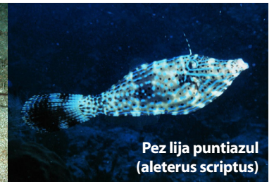
Pez lija punti azul ( Aletherus scriptus )