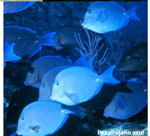
Pez cirujano azul