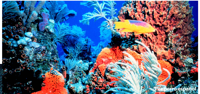
Pez perro español

Los responsables de la gestión de la actividad pesquera aprobó nuevas normas para evitar la pesca excesiva y proteger las especies en el Caribe estadounidense, desde Puerto Rico hasta las Islas Vírgenes.