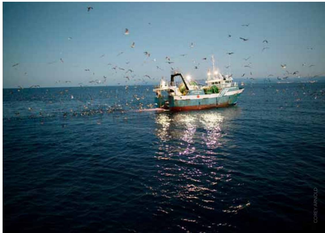
Afbeelding .1 Visvangst in Atlantische Oceaan in tonnen