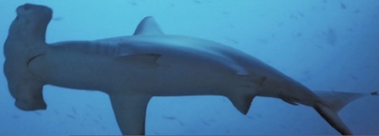
TABLA 2: PORCENTAJE DE VARIACIÓN DE LA ABUNDANCIA Y BIOMASA DE TIBURONES A TRAVÉS DEL TIEMPO EN TODOS LOS PUNTOS DEL MEDITERRÁNEO QUE HAN SIDO OBJETO DE ESTUDIO